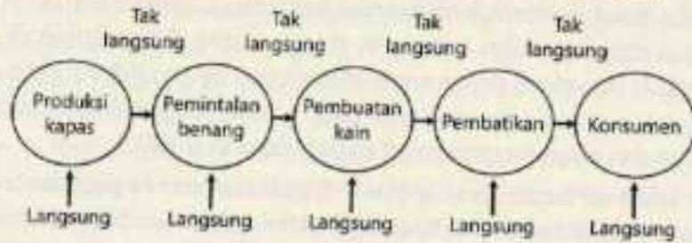
Gambar 2. Jejak Air Langsung dan Tak Langsung pada Tahap Pembuatan Batik pada Seluruh Rantai Pasokan

Meskipun demikian, komunikasi itu juga menjelaskan bahwa kemungkinan untuk lebih fokus pada kegiatan atau proses pembatikan dapat dilakukan. Oleh sebab itu, pada skenario ini, fokus penelusuran jejak air dilakukan pada tahap-tahap pembatikan, mulai dari tahap mempersiapkan kain hingga melepaskan lilin yang menempel pada kain (Gambar 3).