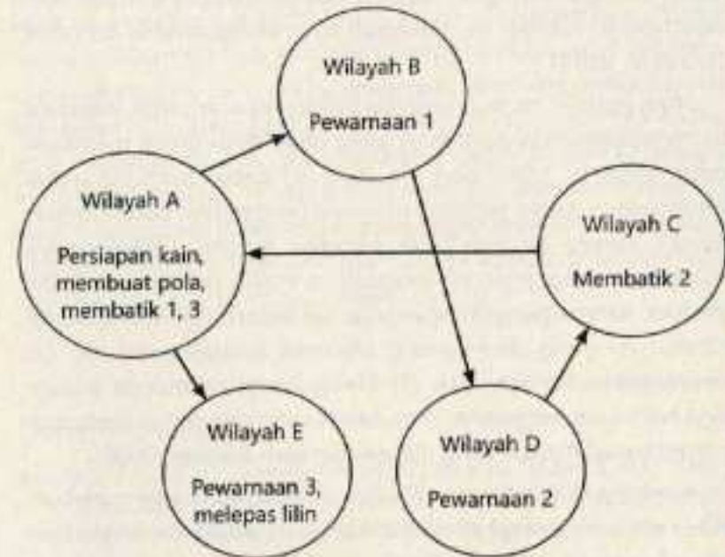
Gambar 4. Penelusuran Jejak Air pada Industri Batik Berbasis Sistem Kerja Rumahan

Sistem Kerja Rumahan, pemecahan rantai produksi batik memberi kemungkinan untuk menelusuri jejak air pada tempat-tempat yang berbeda, menurut ke mana kain yang akan diproses ini "dibawa dan dipindahkan" sesuai tahap produksinya, misalnya seperti pada Gambar 4.